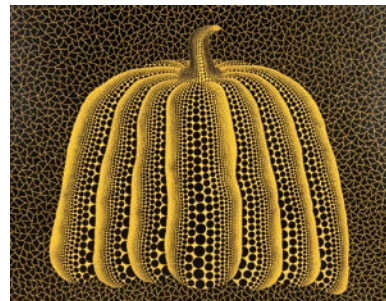
草間彌生(かぼちゃ)1990 © YAYOI KUSAMA Courtesy of Ota Fine Arts

□問い合わせ先 展覧会について 山形美術館/023-622-3090 チケットについて 山形新聞社事業部/023-642-7955