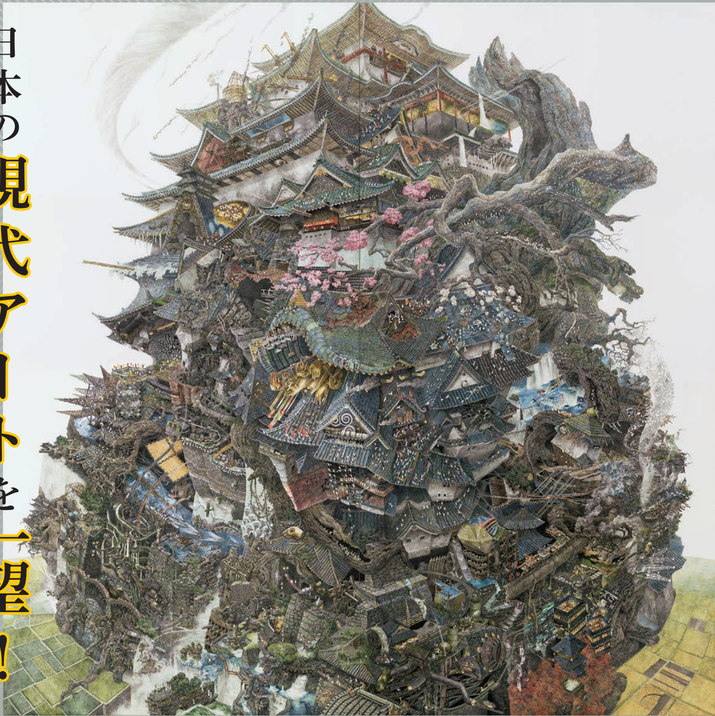
池田学（興亡史）2006 紙にペン、インク 200×200cm Photo by Horiuchi Color Ltd. ©IKEDA Manabu Courtesy of Mizuma Art Gallery